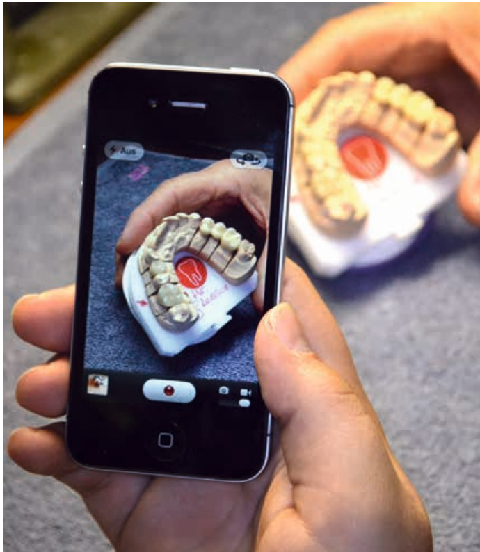
Abb. 2: Den einfachsten Weg, das Video zu erstellen, bietet die Smartphone-Kamera.

Die Länge des Videofilms darf 3 Minuten nicht überschreiten und ist im Format mov, MP4 oder MPEG 4 bei der Geschäftsstelle der AG Keramik einzureichen. Die Einreichungsfrist läuft am 30. Juni 2016 ab. Die drei besten Filme werden mit einem Preisgeld von 3.000 – 2.000 – 1.000 Euro dotiert. Die Jury, d.h. der wissenschaftliche Beirat der AG Keramik sowie ein ZTM bewerten die eingereichten Filme. Die Gewinner werden auf dem nächsten Keramiksymposium im November 2016 vorgestellt.